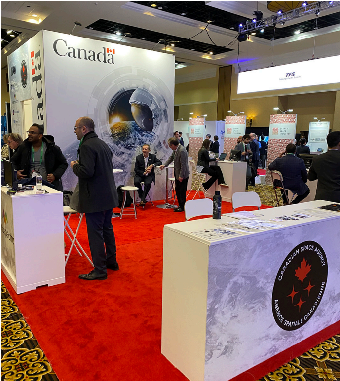
Kiosque du Canada au Symposium sur l'espace