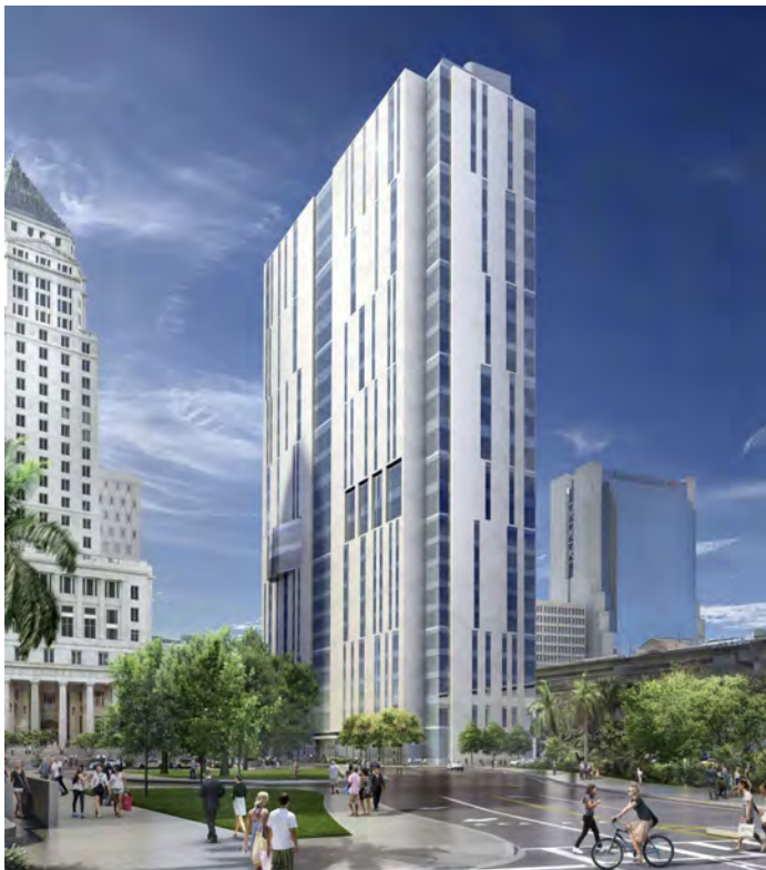
Palais de justice civile et des successions du comté de Miami Dade..