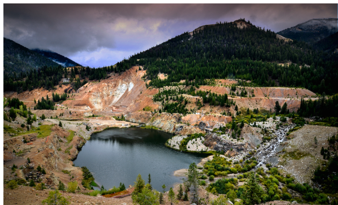
Fosse du projet Stibnite Gold.