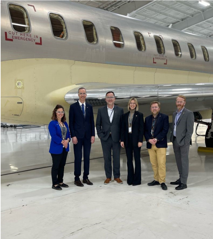
Le Defense Challenger 650 de Bombardier.