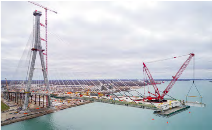
Construction du pont international Gordie-Howe