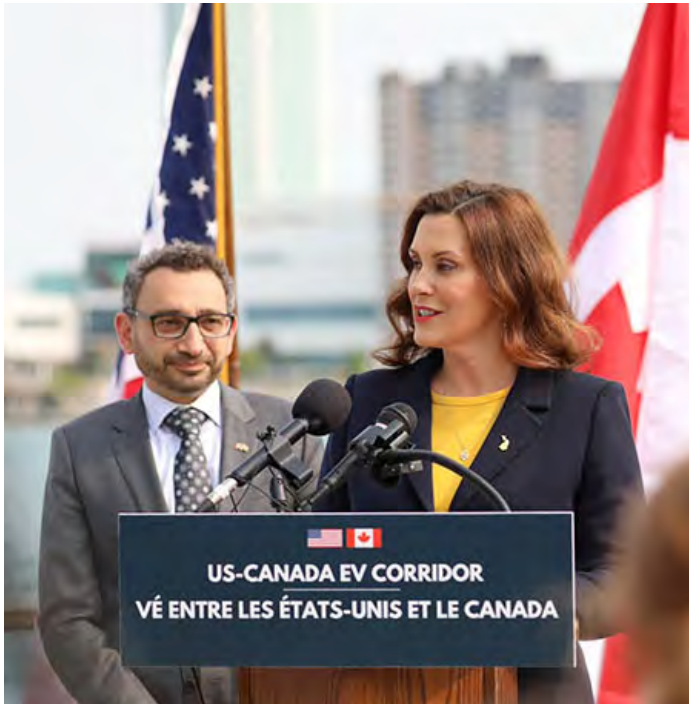
Le ministre des Transports du Canada, Omar Alghabra, et la gouverneure du Michigan, Gretchen Whitmer, lors de l'annonce du corridor électrique entre les États-Unis et le Canada.