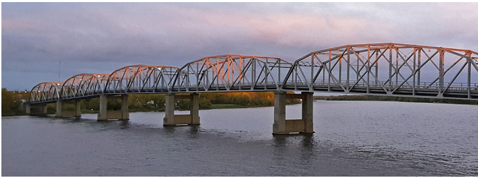
Pont international Baudette–Rainy River.