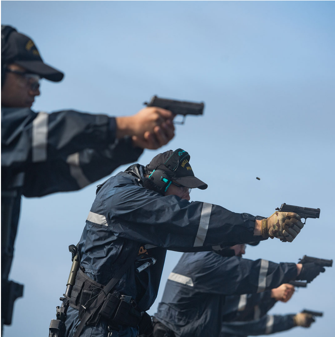
Les membres de l'équipe d'arraisonnement de la marine tirent SIG Sauer P320, alors qu'ils pratiquent leurs exercices de protection de la force.