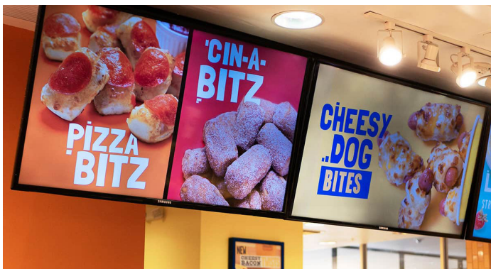
Signalétique Bretzels de Wetzel.