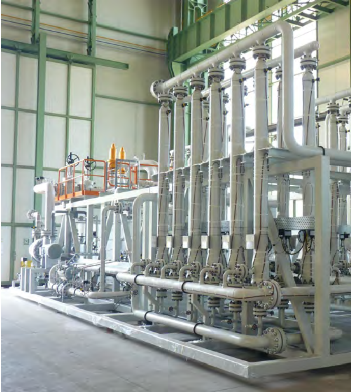
Système de membrane pour la récupération de l'hydrogène.