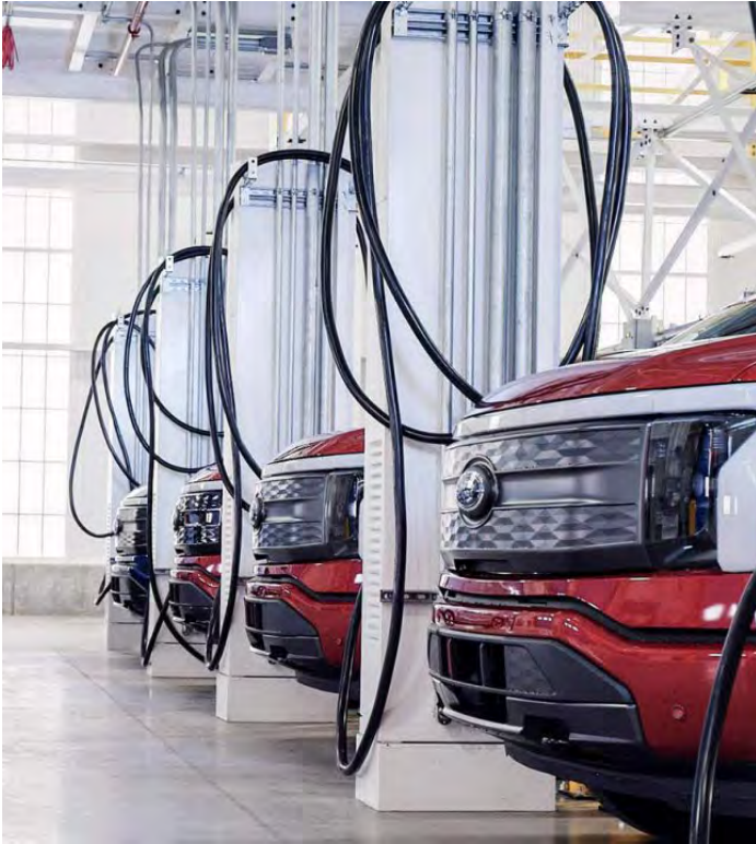
Le Ford F-150 Lightning.