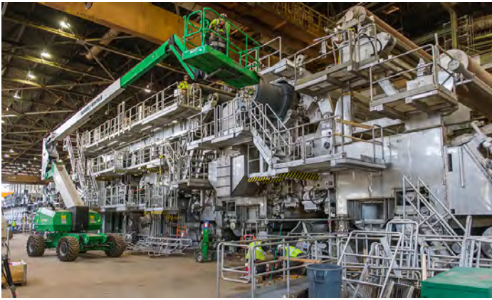
Installation de Bear Island.