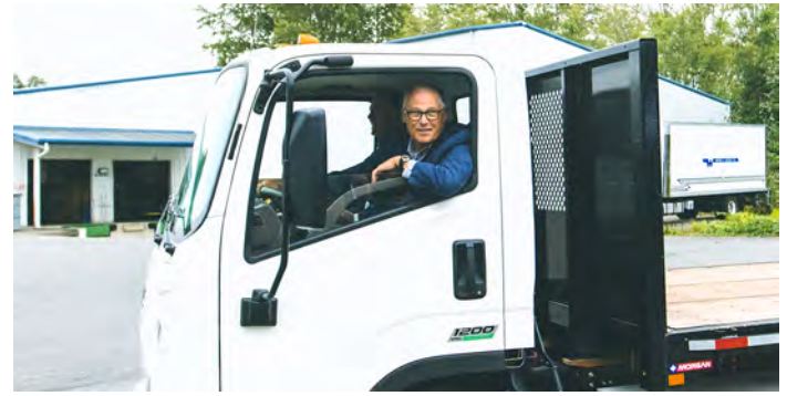
Le gouverneur Jay Inslee fait un tour dans le camion VMC 1200 de Vicinity Motor.

Les impacts sociaux et économiques sont renforcés par les investissements dans le secteur du tourisme autochtone en pleine croissance dans la région du Pacifique Nord-Ouest. Grâce au partenariat d' Expedia Group avec l' Association touristique autochtone du Canada , l'État de Washington et le Canada bénéficient de notre valeur commune visant à promouvoir des économies inclusives et à soutenir le développement économique durable des communautés autochtones sous-représentées dans l'industrie touristique de la région.