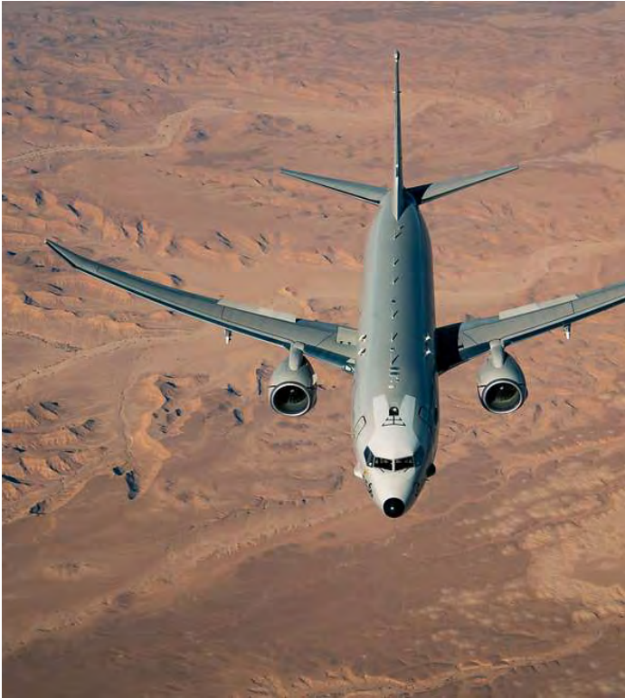
Le P-8A Poséidon